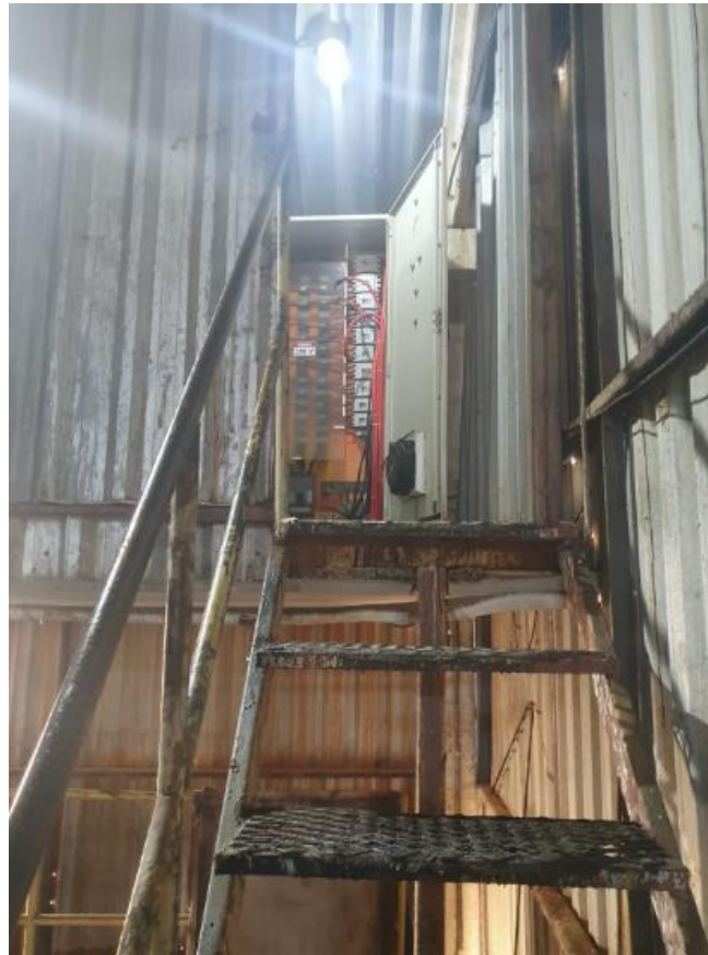
Figura 14 - UTENSÍLIOS E EQUIPAMENTOS.