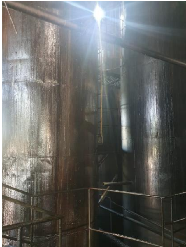
Figura 16 - UTENSÍLIOS E EQUIPAMENTOS.