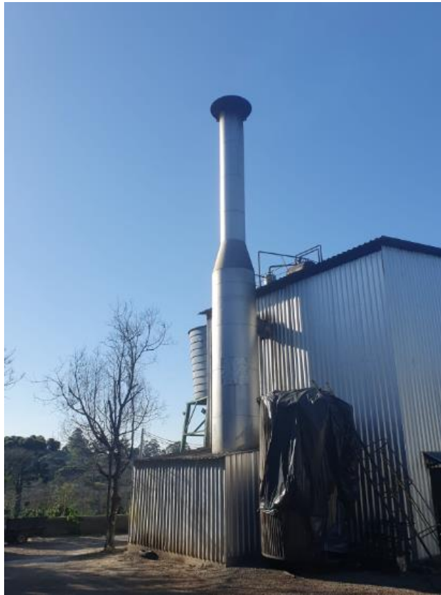
Figura 39 - UTENSÍLIOS E EQUIPAMENTOS.