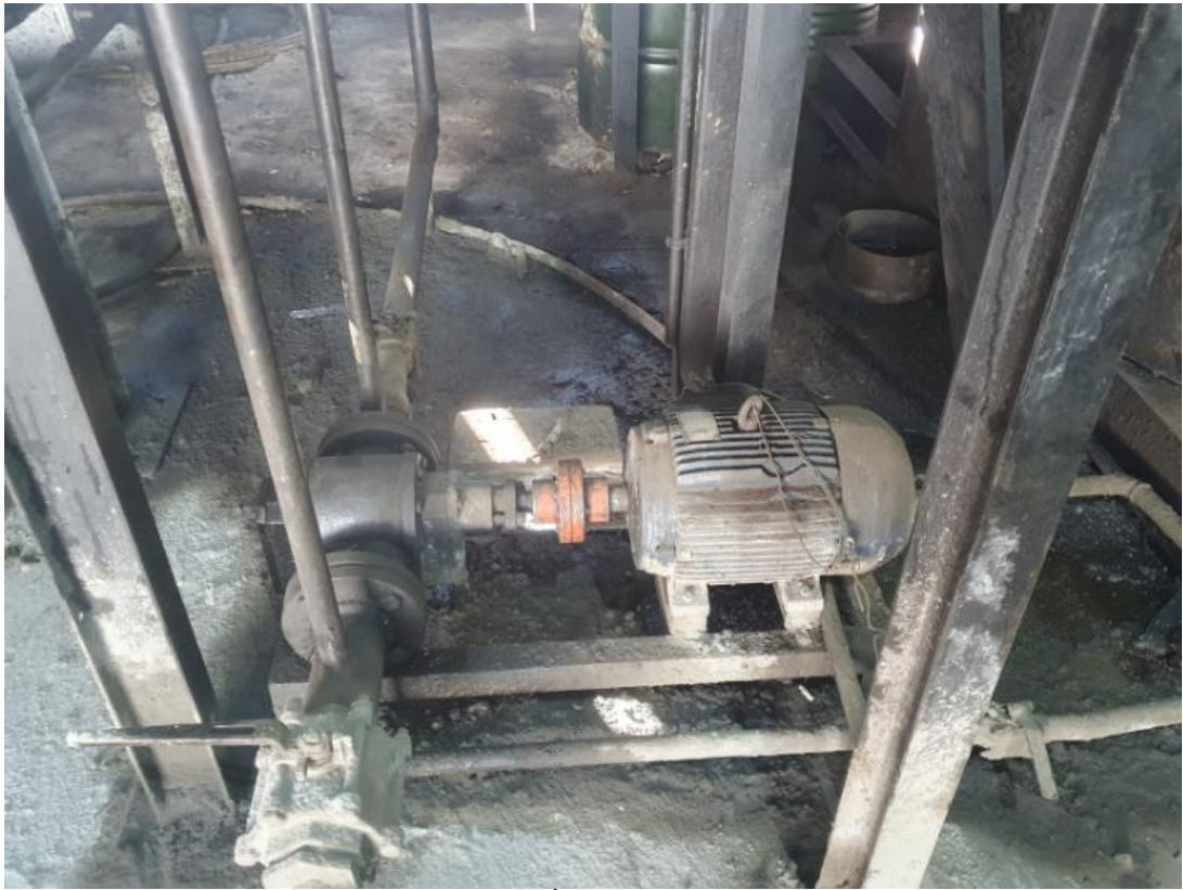
Figura 44 - UTENSÍLIOS E EQUIPAMENTOS.