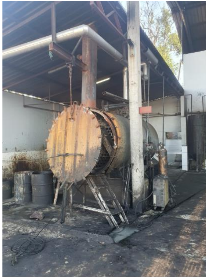
Figura 31 - UTENSÍLIOS E EQUIPAMENTOS.