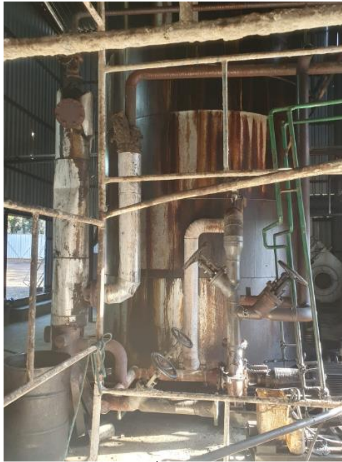
Figura 43 - UTENSÍLIOS E EQUIPAMENTOS.