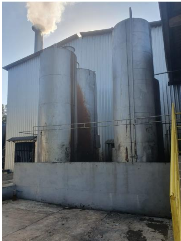
Figura 3 - UTENSÍLIOS E EQUIPAMENTOS.