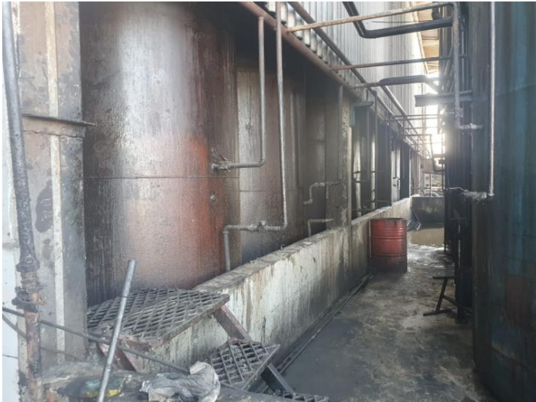
Figura 30 - UTENSÍLIOS E EQUIPAMENTOS.