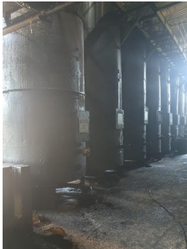
Figura 12 - UTENSÍLIOS E EQUIPAMENTOS.