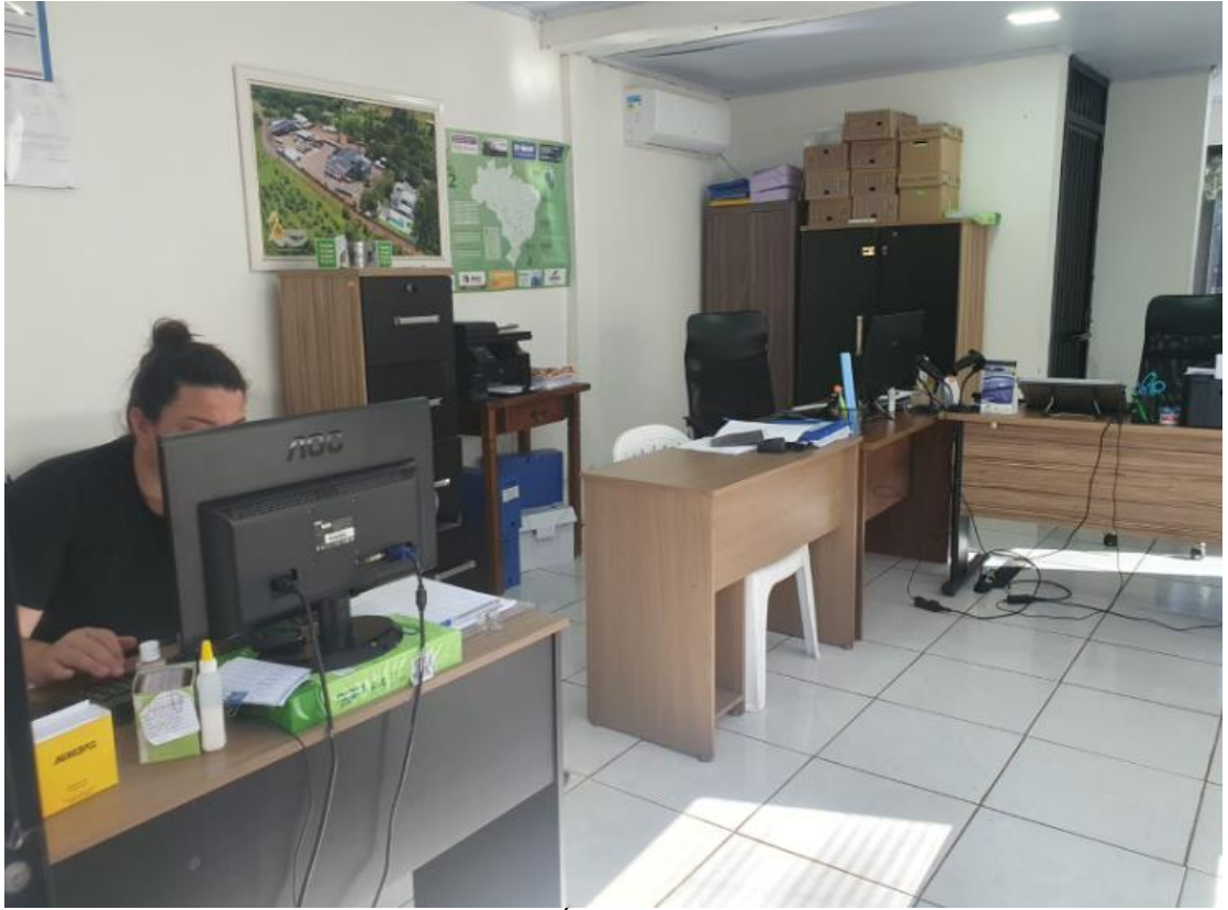
Figura 1 - UTENSÍLIOS E EQUIPAMENTOS.