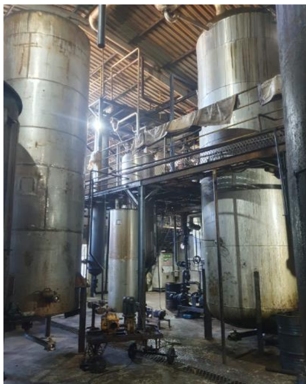
Figura 10 - UTENSÍLIOS E EQUIPAMENTOS.