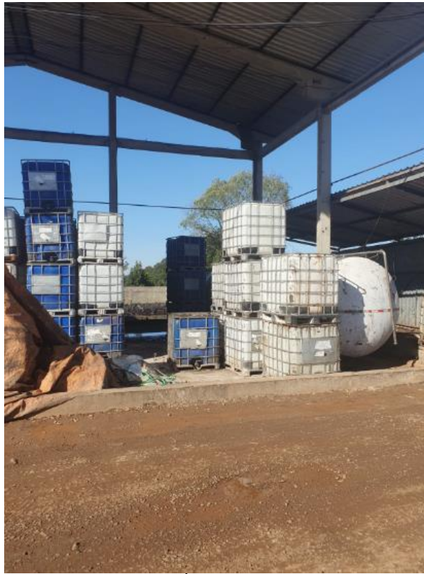
Figura 4 - UTENSÍLIOS E EQUIPAMENTOS.