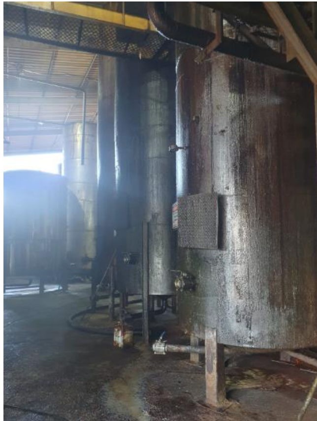
Figura 11 - UTENSÍLIOS E EQUIPAMENTOS.