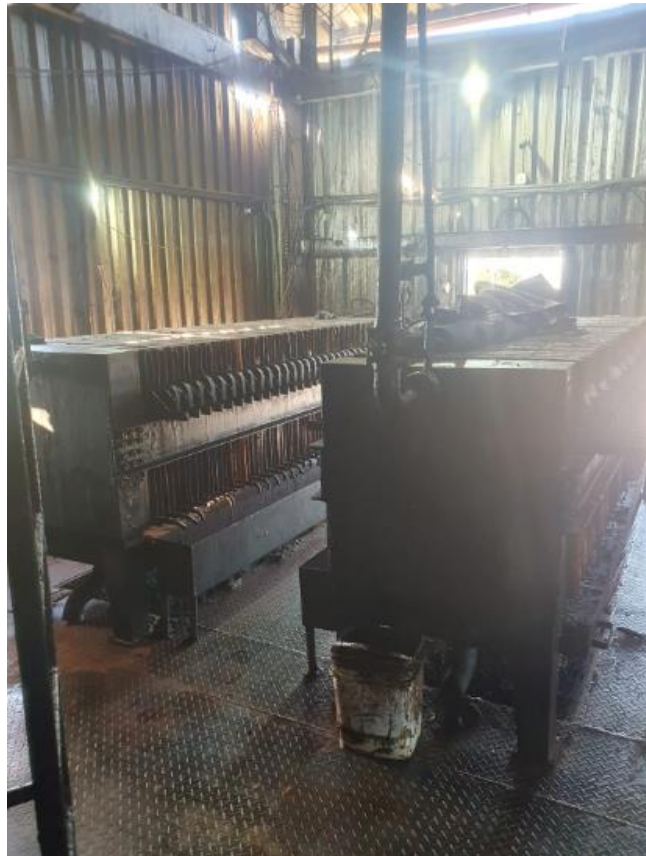
Figura 18 - UTENSÍLIOS E EQUIPAMENTOS.