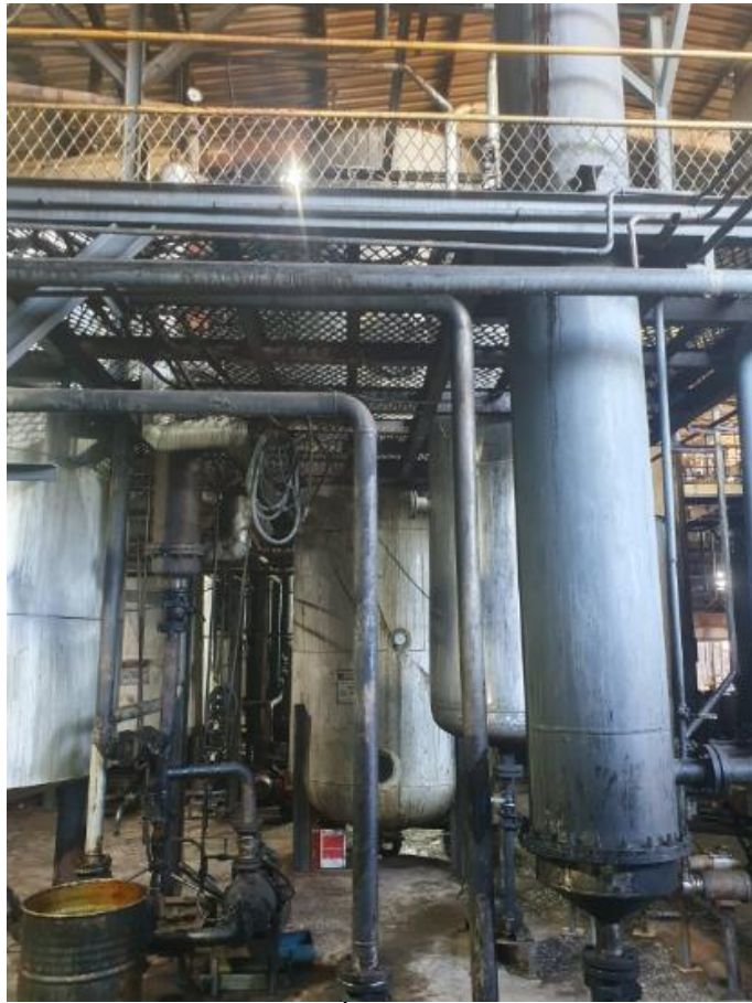
Figura 28 - UTENSÍLIOS E EQUIPAMENTOS.