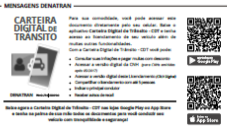
Figura 48 – DOCUMENTOS VEÍCULOS.