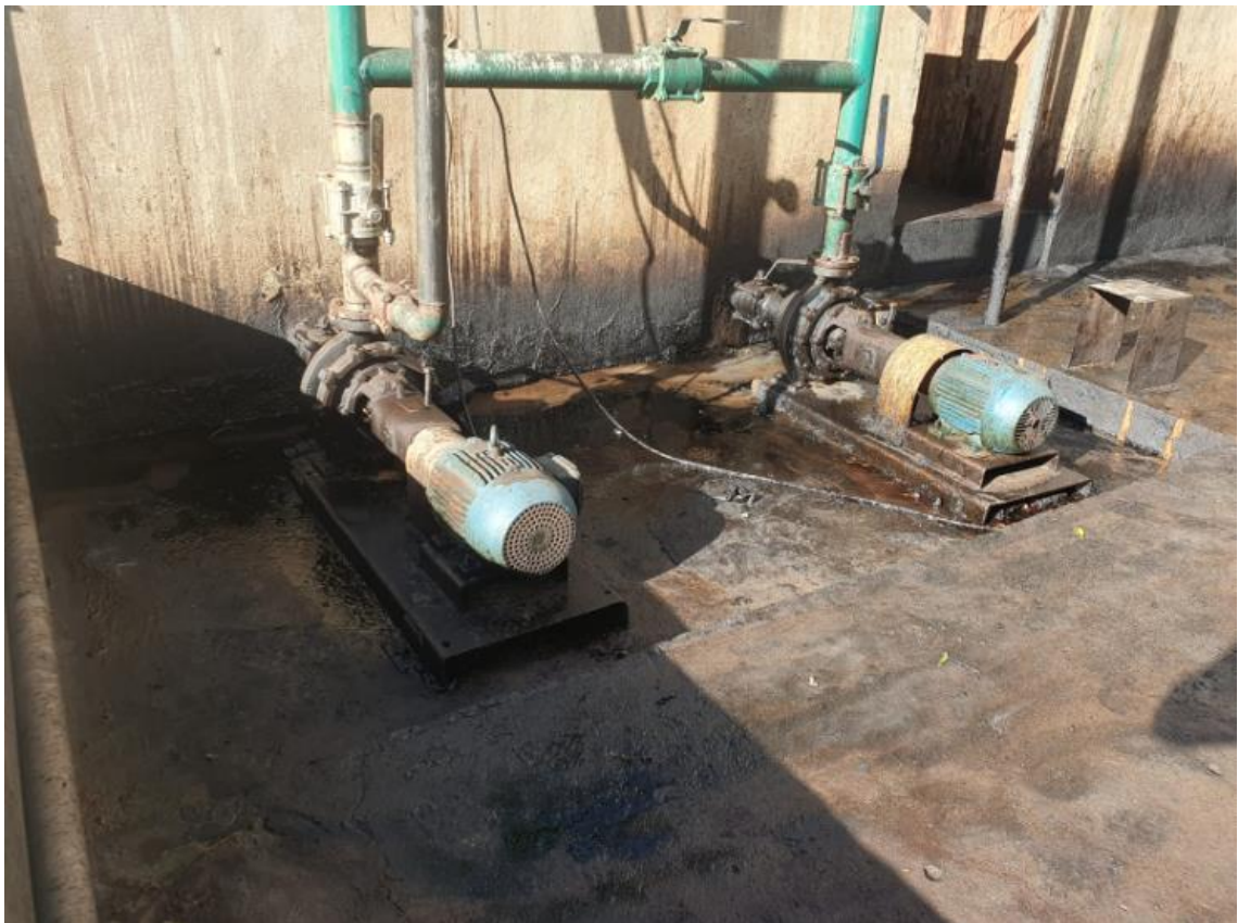
Figura 36 - UTENSÍLIOS E EQUIPAMENTOS.