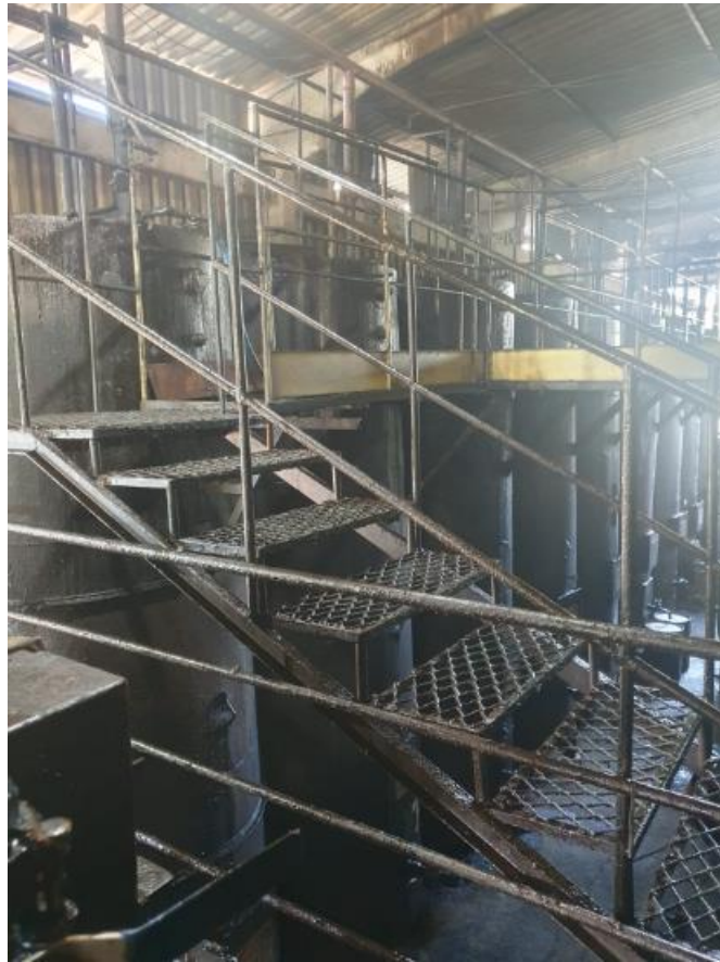
Figura 15 - UTENSÍLIOS E EQUIPAMENTOS.