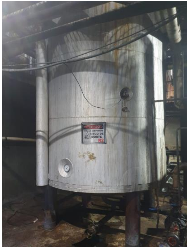
Figura 23 - UTENSÍLIOS E EQUIPAMENTOS.