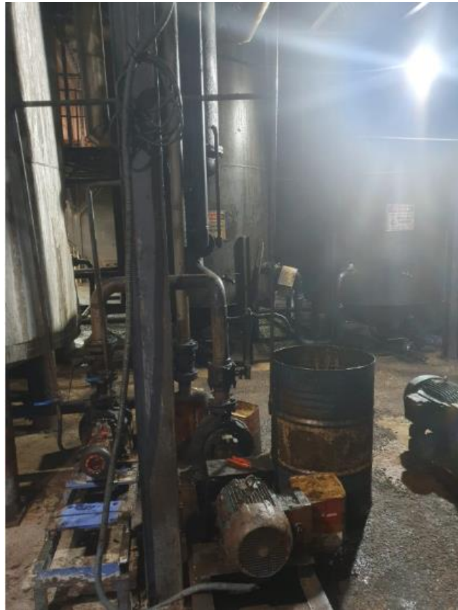
Figura 25 - UTENSÍLIOS E EQUIPAMENTOS.