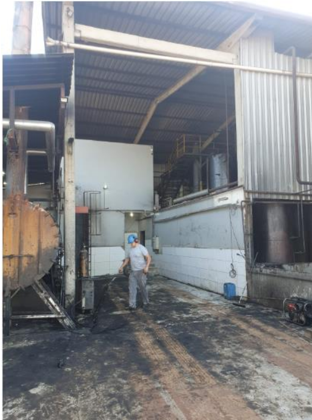
Figura 7 - UTENSÍLIOS E EQUIPAMENTOS.