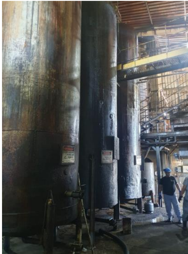
Figura 20 - UTENSÍLIOS E EQUIPAMENTOS.