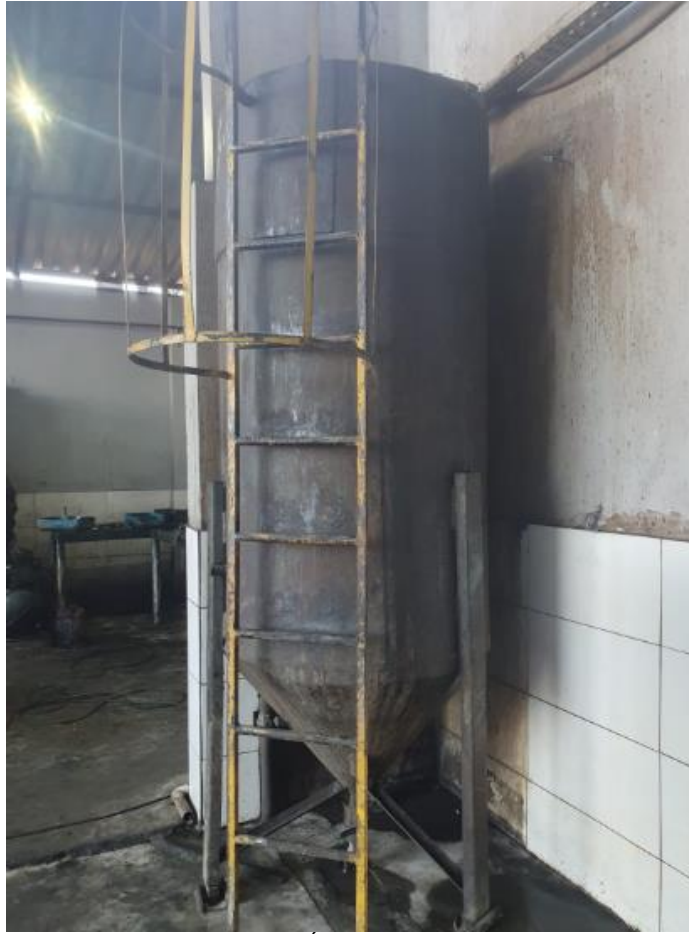
Figura 34 - UTENSÍLIOS E EQUIPAMENTOS.