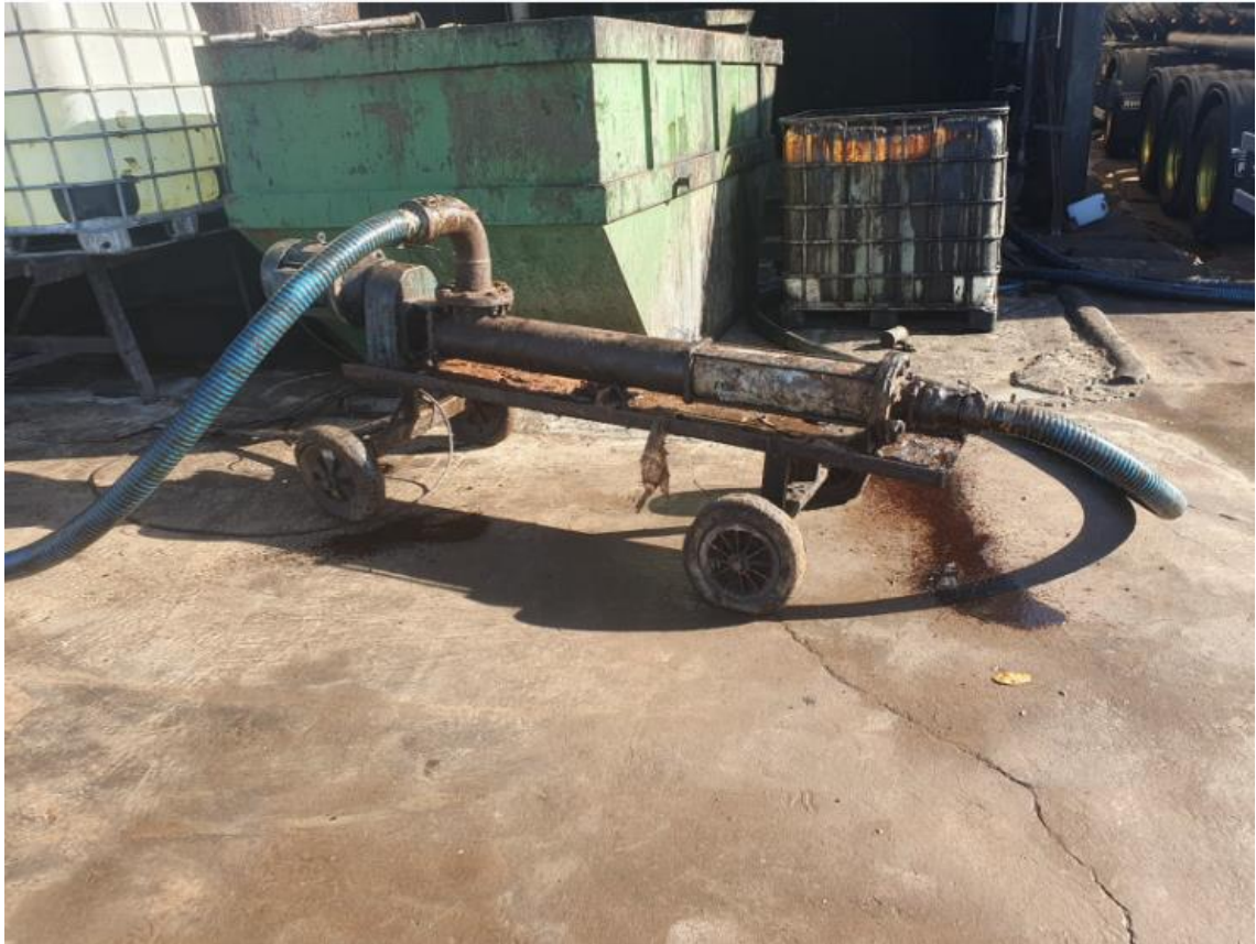
Figura 47 - UTENSÍLIOS E EQUIPAMENTOS.