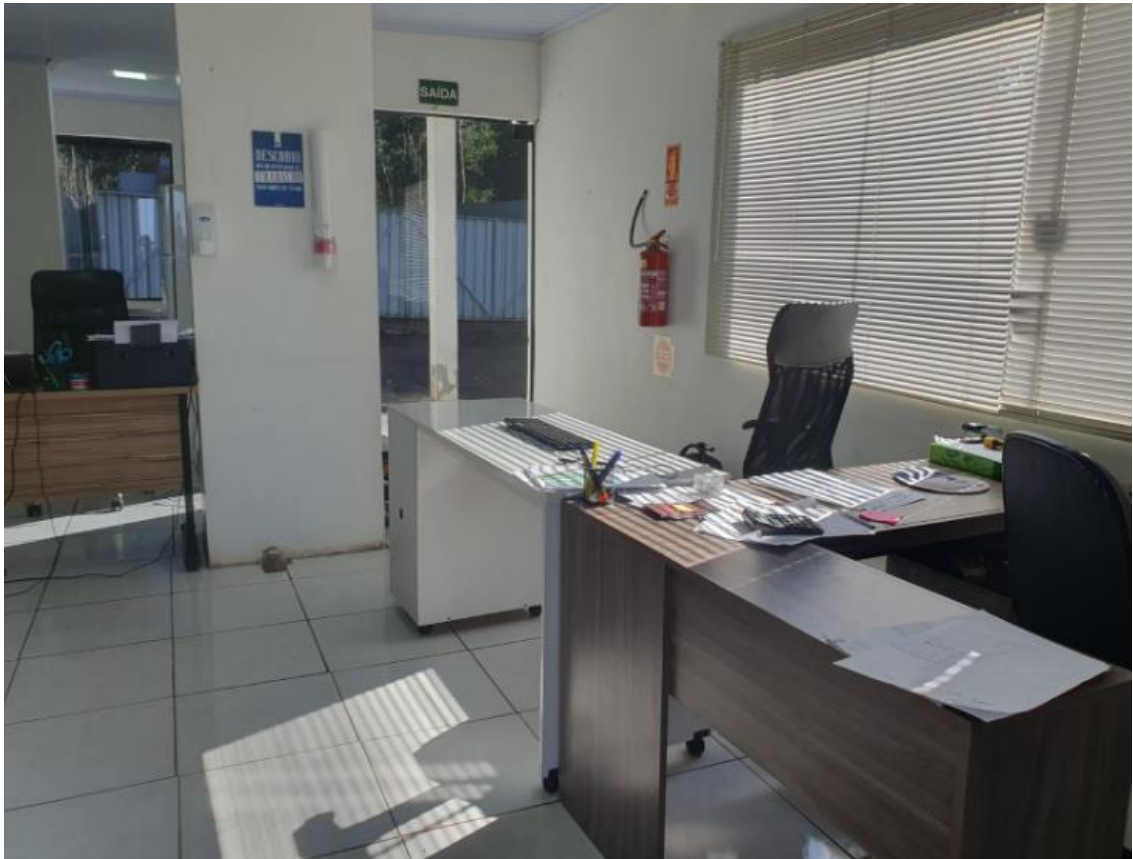
Figura 2 - UTENSÍLIOS E EQUIPAMENTOS.