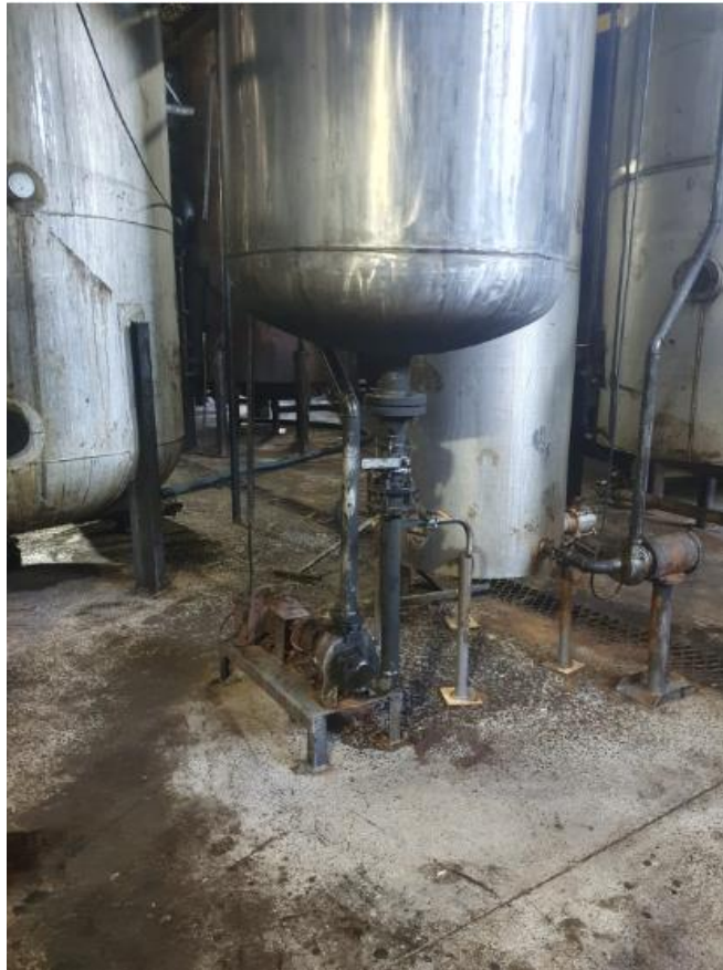
Figura 24 - UTENSÍLIOS E EQUIPAMENTOS.