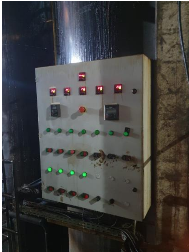
Figura 17 - UTENSÍLIOS E EQUIPAMENTOS.