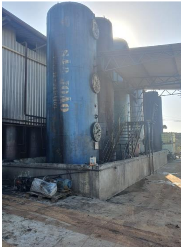
Figura 8 - UTENSÍLIOS E EQUIPAMENTOS.