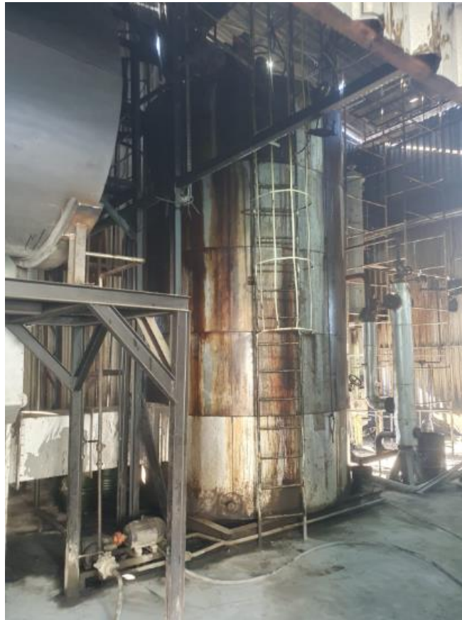
Figura 40 - UTENSÍLIOS E EQUIPAMENTOS.