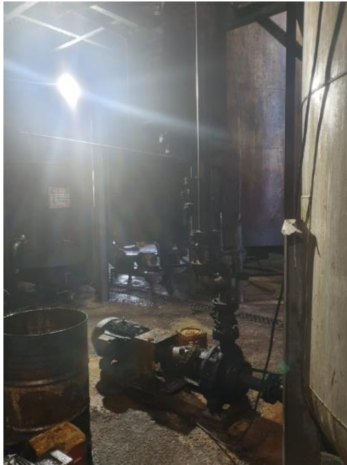
Figura 22 - UTENSÍLIOS E EQUIPAMENTOS.