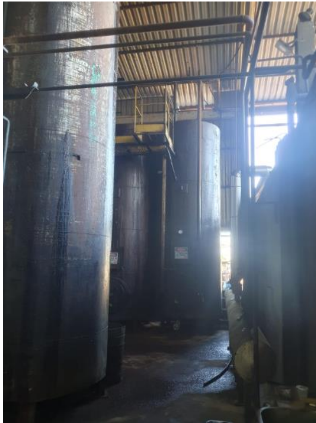
Figura 26 - UTENSÍLIOS E EQUIPAMENTOS.