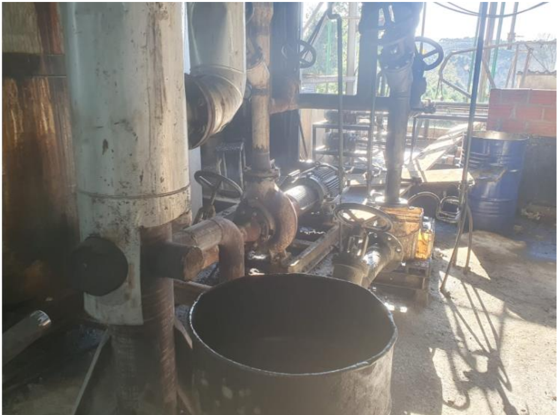
Figura 45 - UTENSÍLIOS E EQUIPAMENTOS.