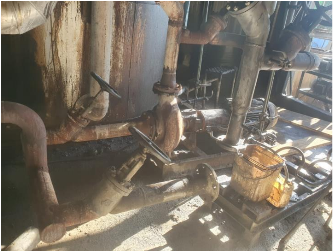
Figura 46 - UTENSÍLIOS E EQUIPAMENTOS.