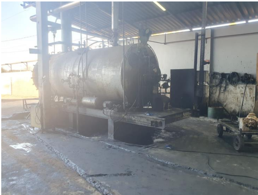
Figura 33 - UTENSÍLIOS E EQUIPAMENTOS.