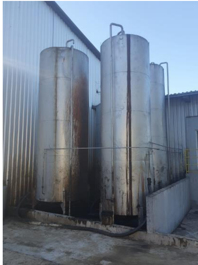
Figura 41 - UTENSÍLIOS E EQUIPAMENTOS.