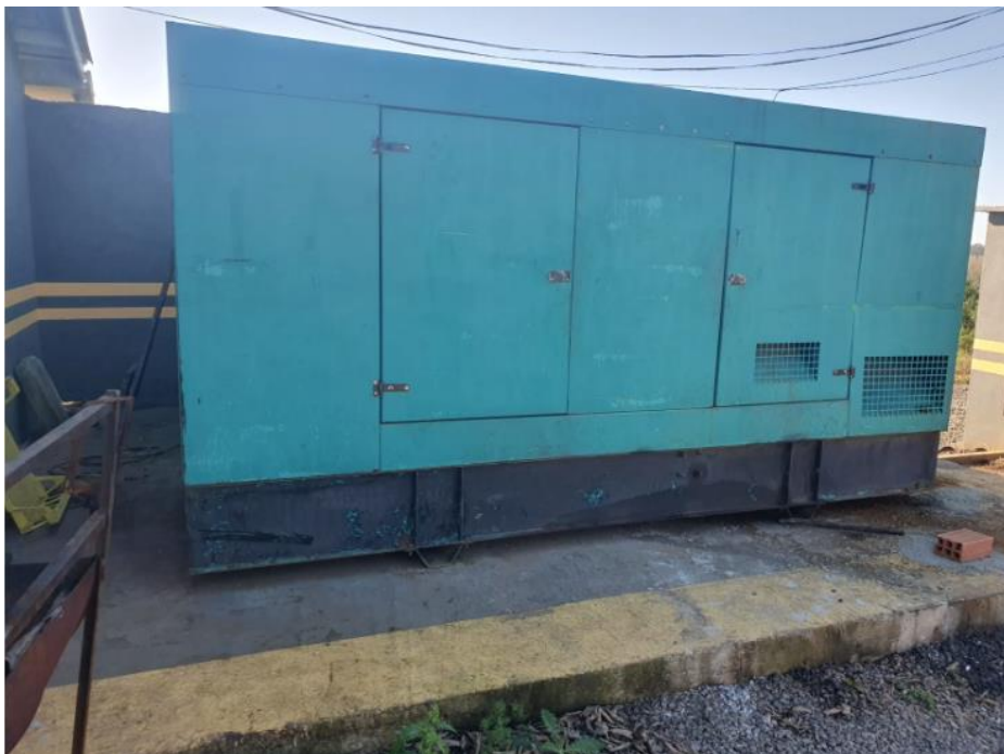
Figura 5 - UTENSÍLIOS E EQUIPAMENTOS.