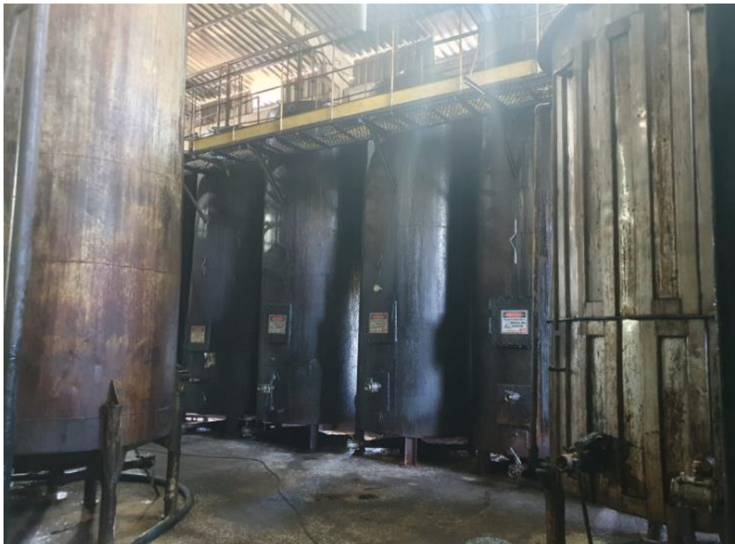
Figura 21 - - UTENSÍLIOS E EQUIPAMENTOS.