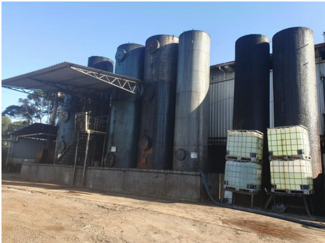
Figura 32 - UTENSÍLIOS E EQUIPAMENTOS.