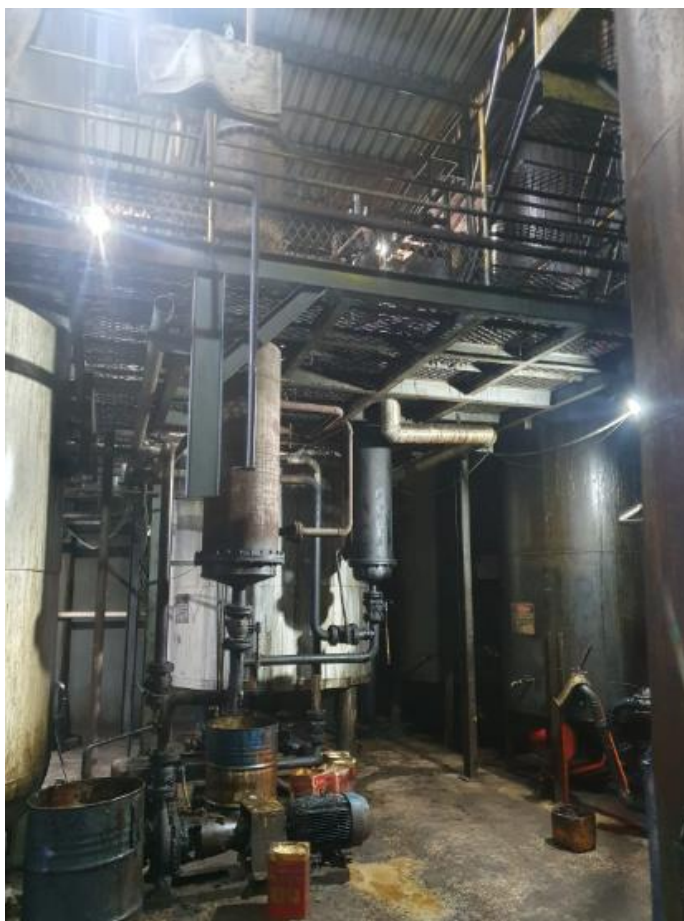
Figura 9 - UTENSÍLIOS E EQUIPAMENTOS.