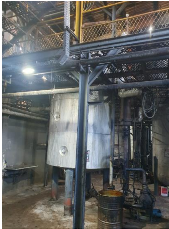
Figura 29 - UTENSÍLIOS E EQUIPAMENTOS.