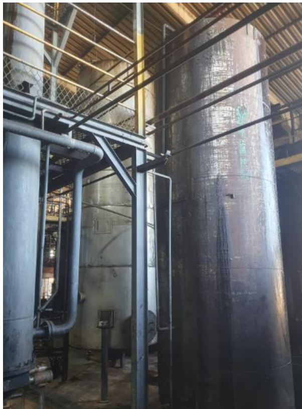
Figura 27 - UTENSÍLIOS E EQUIPAMENTOS.