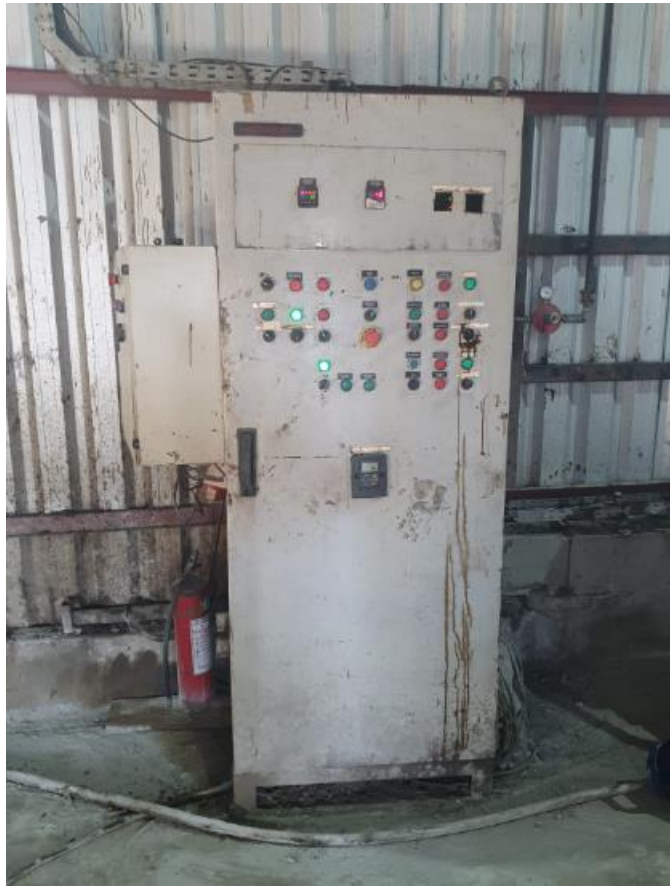
Figura 38 - UTENSÍLIOS E EQUIPAMENTOS.