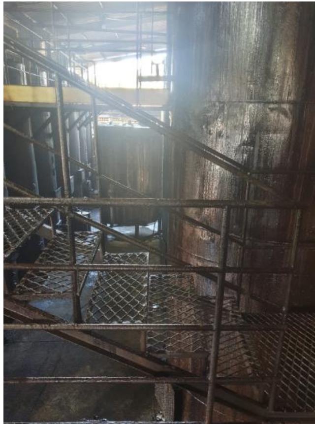
Figura 13 - UTENSÍLIOS E EQUIPAMENTOS.