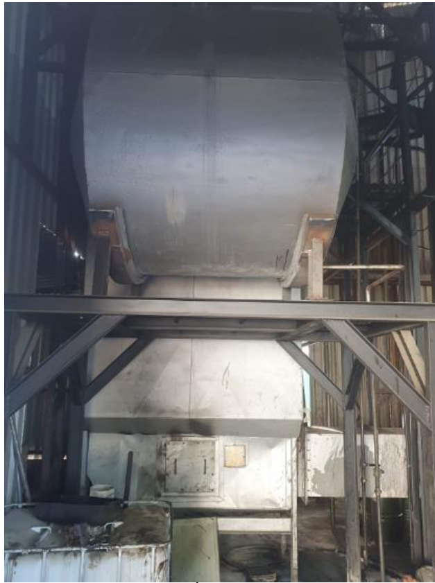
Figura 42 - UTENSÍLIOS E EQUIPAMENTOS.