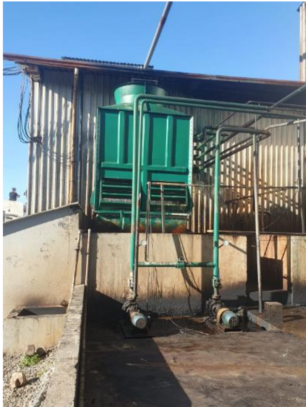
Figura 37 - UTENSÍLIOS E EQUIPAMENTOS.