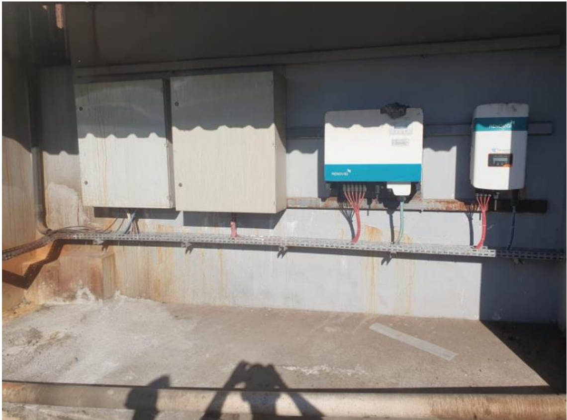
Figura 35 - UTENSÍLIOS E EQUIPAMENTOS.